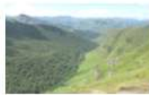
Paysans et paysages