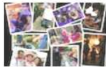
Du berceau à la tombe