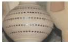
Quilles de neuf