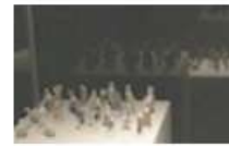
Fève et couronne