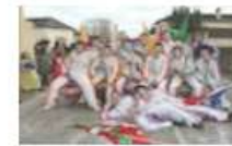
Faire les blancs