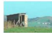
Chasse à la palombe