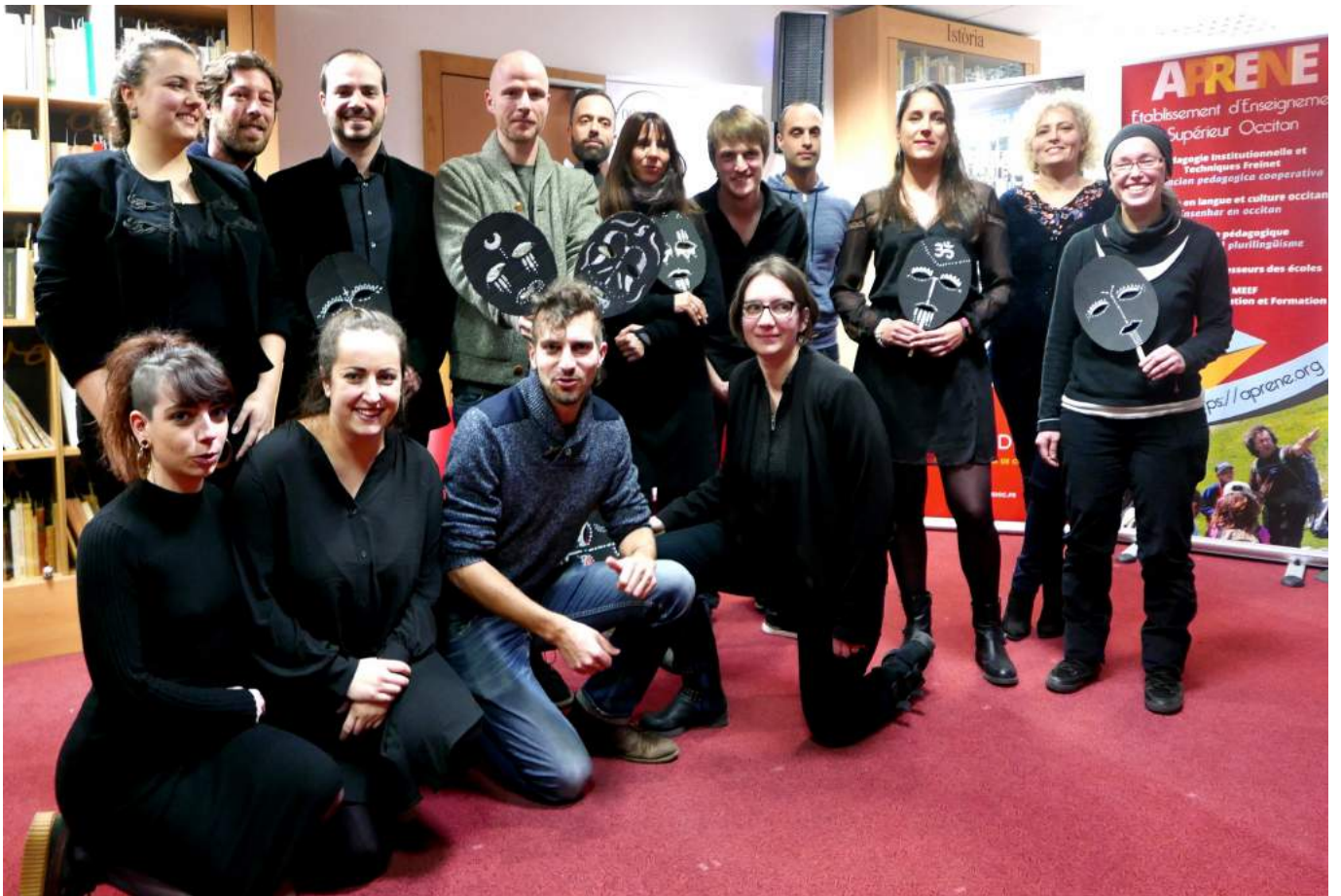
Fòto de la còla amb lo grop Uèi.