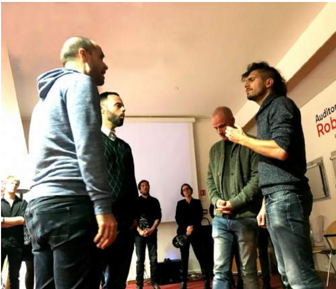
Moment a capella del grop Uèi