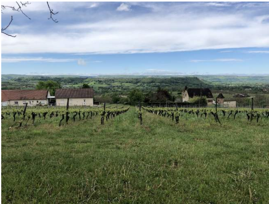
Las vinhas de Glana, amont dins la montanha, al dessus de la valada cavada per la Dordonha.