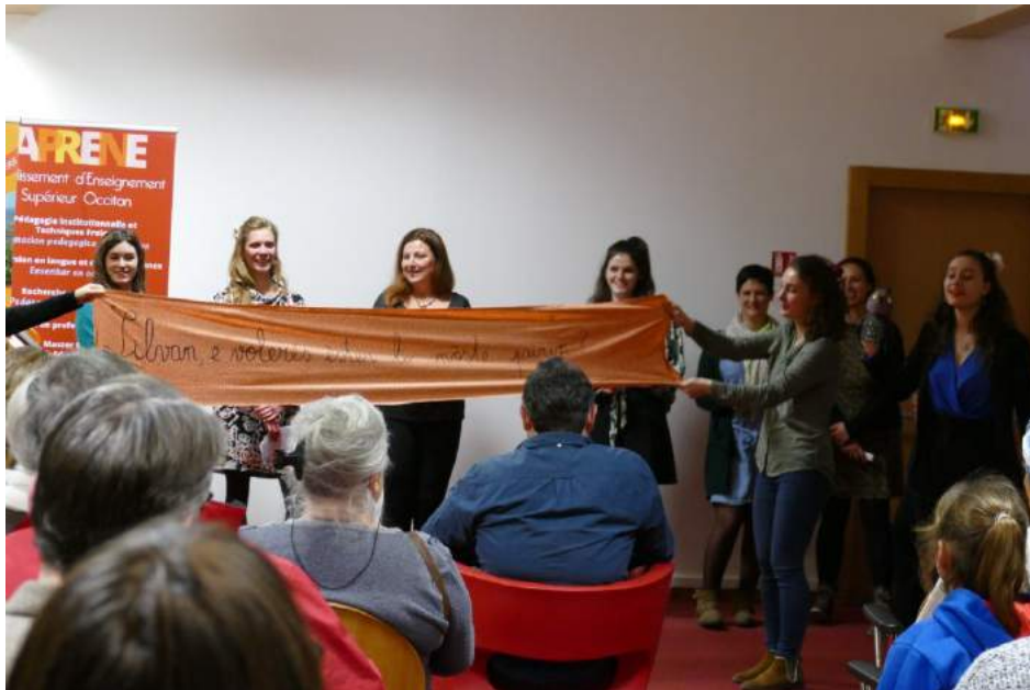
Batejada dab Sivan Carrera Tisné, lo pairin pairin que nosta còla ac pòrta son nom.